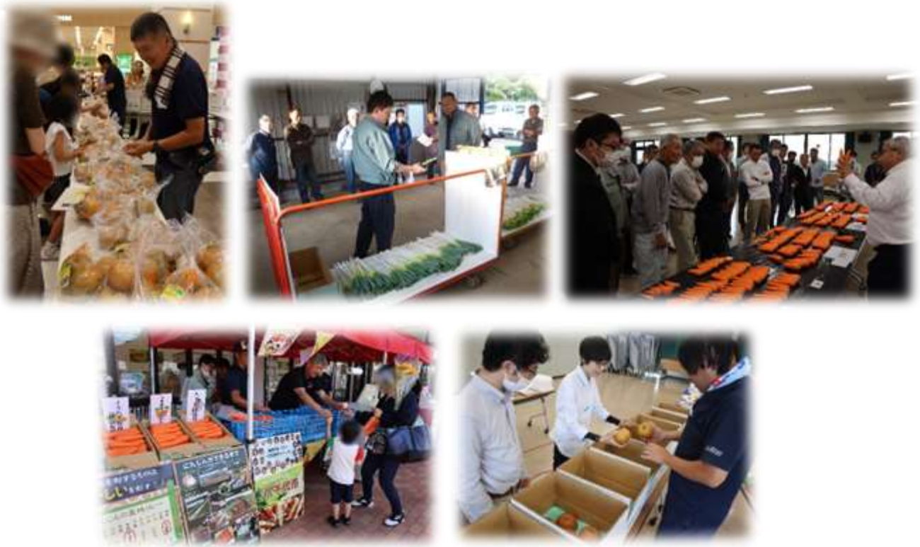
▲ニンジン・ネギ・梨などの各種共進会、販売PRイベントを開催しました。

また、梨やニンジンのPR即売会を行い、旬を迎えた農産物の販売促進を図り、消費者へ地元農産物の発信を行いました。さらに、八千代市園芸協会はイオン八千代緑が丘でPR即売会も行うなどのプロモーション活動を展開することで、多くの消費者に旬の農産物をアピールに努めました。