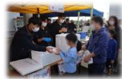
▲「秋の収穫祭」の様子