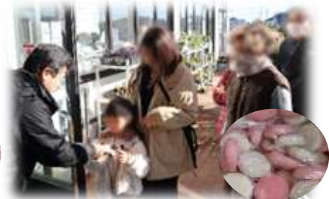
▲「よったいよ」3周年記念イベントの様子