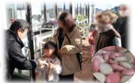
▲「よったいよ」3周年記念イベントの様子