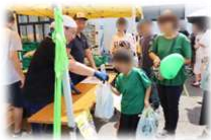
▲「トウモロコシ祭り」の様子

さらに、12月に3周年を迎えた「よったいよ」が日頃の感謝を込めて、先着200名への紅白餅の振る舞い、その他にもガラポン・みかんの詰め放題などを行いました。様々な催し物を通じて、地元産農産物や農業への関心を高めてもらうことが出来ました。