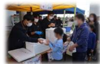
▲「秋の収穫祭」の様子