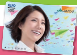
※カードはイメージです。

〈お申込期間〉平成29年2月1日～5月末日まで(当日消印有効) 〈対象〉平成29年2月から6月に新たにJAで給与受取口座を指定し、いずれかの月において5万円以上の給与のお受取りが確認できたお客さま。