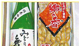
JAちばみどり 純米吟醸「みどりの舞」と ゆで落花生「郷の香」