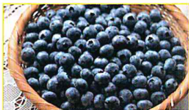
JAいすみ いすみ産ブルーベリー