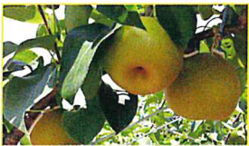
JA八千代市 八千代産梨