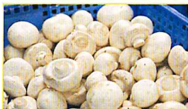
JAかとり マッシュルーム