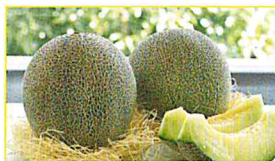
JA山武郡市 さんぶのネットメロン