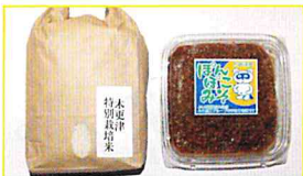
JA木更津市 にこまる・ぼんぼこ味噌