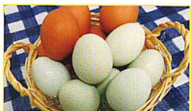
JAきみつ 青と赤の新鮮たまごセット