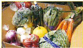
JA千葉みらい 食育ソムリエが選ぶ 旬の野菜BOX