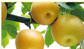
JAとうかつ中央 松戸の梨