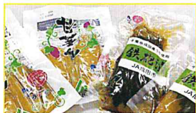
JA成田市 甘芋ん(干し芋)と 瓜の鉄砲漬