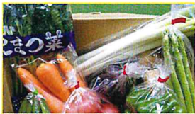
JA富里市 ふるさと産品野菜セット