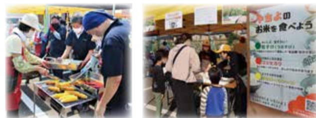
▲昨年は3年ぶりに夏・秋のお祭りを開催！大盛況でした。

ファーマーズマーケット「よったいよ」では、各種イベントを開催して地場農産物のアピールを行ったり、来店者がより魅力的に感じる店内作りを心掛けています。円滑な運営を行うことで、地域の活性化と農業者の所得増大に繋げています。