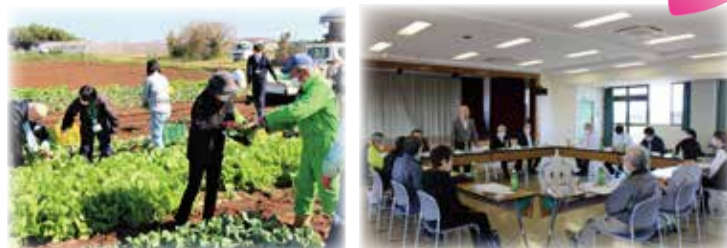
▲准組合員セミナーでは収穫体験とJA役員との意見交換の場を設けました。

正組合員と准組合員が一体となったJA運営を実現するため、准組合員を「正組合員とともに農業や地域経済の発展を共に支える組合員」と位置付け、准組合員の声を経営に反映させる為、積極的に対話を行い、一層の事業利用と組合員組織や協同活動への参加を進めています。