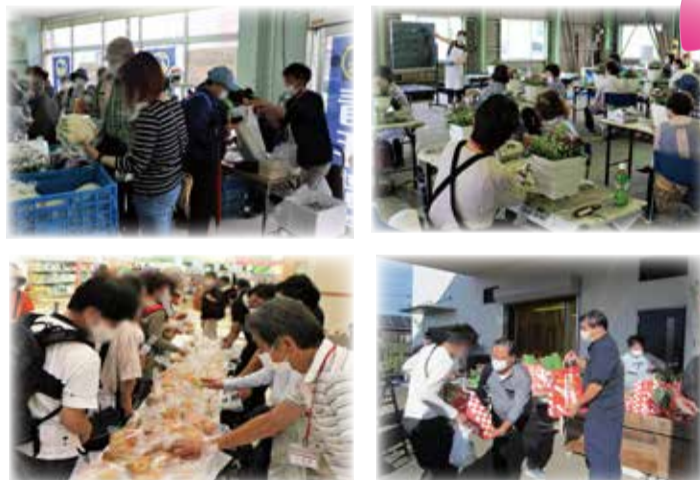
▲各種農産物のPR販売や講習会の様子

青年部・女性部・フレッシュミズ・アンシャント倶楽部・ニンジン部会・ネギ部会・八千代市梨業組合・八千代市園芸協会など各種生産部会の活動を支援しています。それぞれの部会が活気づき、積極的に活動を行うことで消費者との交流の機会が増え、地元農業への理解促進や地場農産物のPRを行っています。